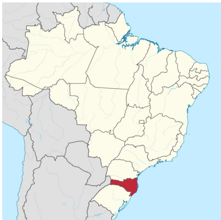
Mapa Político de Santa Catarina